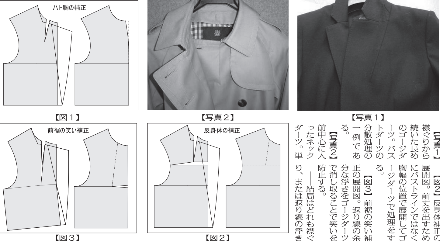
【写真1】分散処理の一例である。【写真2】で消し取った笑い補正の補正。【写真3】反身体胸の補正。【写真4】反身体胸の補正。【写真5】反身体胸の補正。

ゴジダーツには主に次の目的が考えられる。ついでに後述するとして、体型やシルエット、補正を目的としたゴジダーツについて説明する。 ●ハト胸の補正 ●反身体胸の補正 ●前裾の笑い補正 ●バストダーツの分散